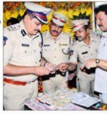
స్థానిక ఎంపీపీ భర్త, సగదు, రాజకీయమైంట్లను పరిశీలిస్తున్న సీపీ భగవత్